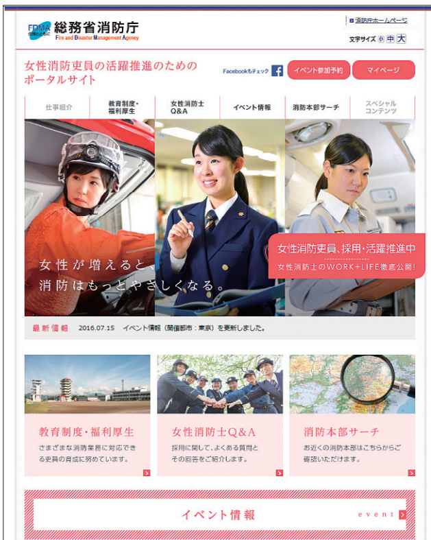
ポータルサイトトップ画面

＜女性消防吏員の活躍推進のためのポータルサイト＞ URL : http://www.fdma.go.jp/josei_shokuin/index.html